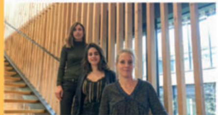
Redon. Elles veulent aider les créatrices d'entreprises ouest-france.fr

Prochaine réunion le 19 décembre de 9h à 11h Plus de renseignements https://bit.ly/2zQD9X0