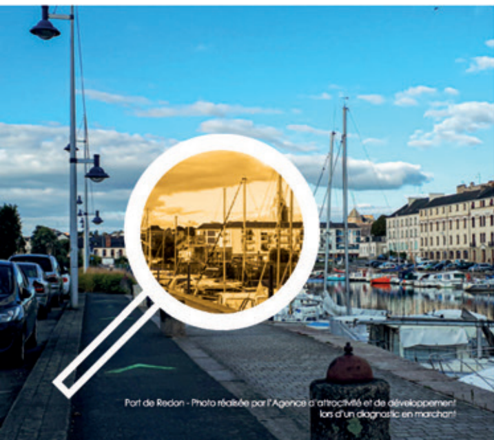
Port de Redon - Photo réalisée par l'Agence d'attractivité et de développement lors d'un diagnostic en marchant!