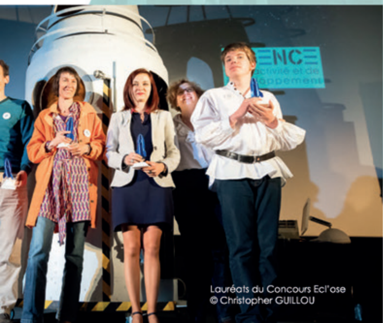
Lauréats du Concours Ecl'ose